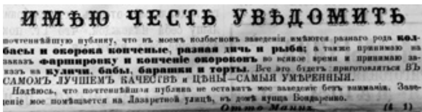
Уфимский листок объявлений и извещений. 1884. 12 марта