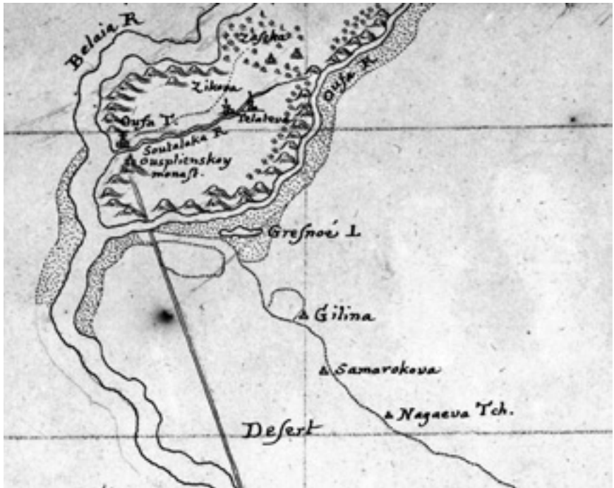
Карта 2. Уфа