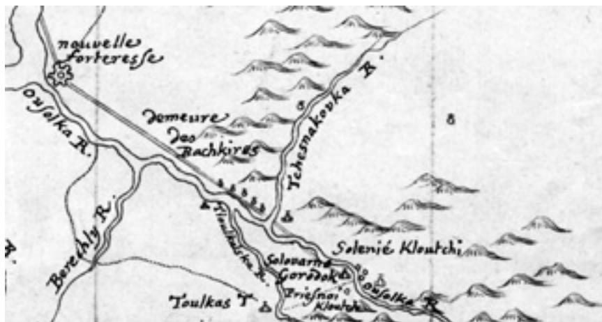
Карта 1. Район Табынска

Комментарии: 1. Верхний левый угол – место, где предполагалось строить Табынскую крепость (nouvelle forteresse – «новая крепость») в устье р. Усолки. 2. В центре, по правому берегу р. Чесноковки – покрытый лесом увал, обозначен как demeure des bachkires – «обиталище башкир». По левому берегу Чесноковки, близ устья, обозначена деревня, возможно, крестьян Уфимского Успенского монастыря 2 . 3. Выше по течению Усолки, на левом берегу – Соловарный городок, на месте корпусов курорта «Красноусольск». Южнее и по правому берегу – соляные варницы. Далее к востоку обозначено строение, очевидно, на месте бывшего острога Вознесенского монастыря 3 . 4. Западнее, на правом берегу речки Тюлькас – одноимённая деревня, известная по документам XVII–XVIII вв. 4