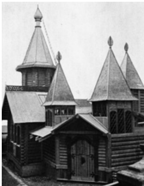
Кустарный павильон на Всемирной выставке 1900 г. в Париже. Архитектор И.Е. Бондаренко, 1899 г. (интернет)

рижским павильонам, которые позволяют сравнить образные эскизы Коровина со степенью детализации чертежей Бондаренко, превративших фантазии художника в реализуемые архитектурные формы. Неудивительно, что награду Выставки по архитектуре за павильоны получил только он 1 .