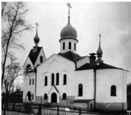
Старообрядческая церковь во имя Святой благоверной княгини Анны Кашинской в селе Кузнецы Павлово-Посадского района Московской области. Фото первой половины XX в. (Бондаренко И.Е. Записки художника-архитектора. Кн. 1. Ч/б вкладка)

Двенадцати апостолов на Пропастях (1454–1455), и Пскова – церкви Георгия со Взвоза (конец XV в.), Богоявления с Запско-вья (1496), Успения Богородицы с Пароменья (XV в.), Петра и Павла с Буя (XVI в.), Николы со Усохи (XVI в.) и некоторые другие, в которых была ярко проявлена характерная особенность храмов XIV–XV вв. – трёхлопастное завершение фасадов, сочетавшееся с многолопастной, немного заглублённой в плоскость аркой-нишей и декоративными вставками из бегунца, поребрика и квадратных кахелей. Однако в его интерпретации есть одна особенность – он ориентировался не только на известные памятники Новгорода и Пскова, но и на образы скромных провинциальных сельских храмов XIX в. с их развитыми входами, папертиями, трапезными и колокольнями. Например, на такие, как деревянная Петропавловская церковь в Тезине 1 , на которую похож по общей композиции его храм во имя Святой благоверной княгини Анны Кашинской (1909) в с. Кузнецы Павлово-Посадского района Московской области.