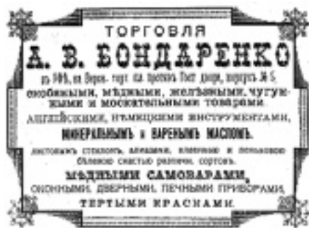
Адрес-календарь Уфимской губернии и справочная книжка на 1905 год. Уфа, 1905. Рекламные объявления