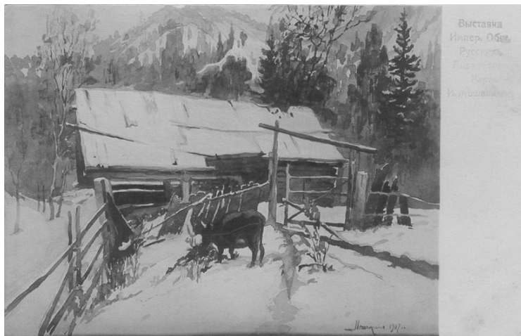
Надпись на открытке. Выставка Императорского общества русских акварелистов. И. Мешалкин. Март. 1907 г.

1947) стал известным художником. В 1907 г., как член Императорского Общества русских акварелистов, участвовал в выставках этого общества (репродукция с его картины далее).