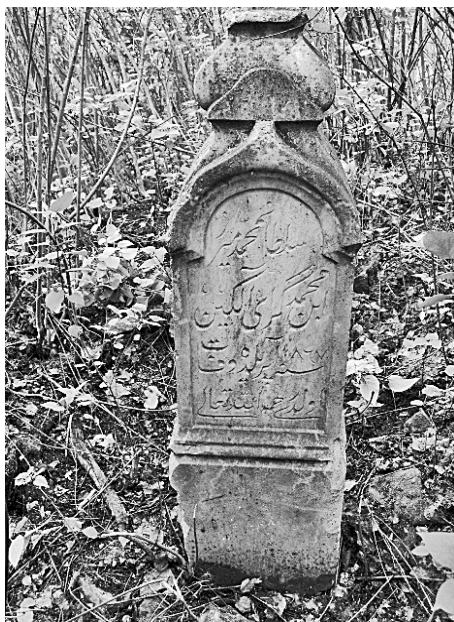
Кладбище дер. Узы-Тамак. Памятник Султана Алкина.